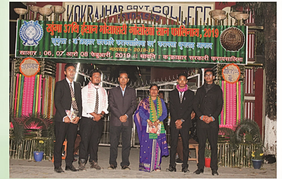
खुंगा 37थि ईशान मोसाहारी गोसोखां सान फालिनायाव आलासि बिथांमोनजें गेटनि सावगारि नुथाय।