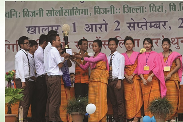
सानजारां लक्षेश्वर ब्रह्मनि थैनाय गोसोखां सान फालिनायाव साबसिन बादायारि फरायसालिमा बान्था आजवानाय।