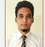
वेलसन इस्लारी सोद्रोमा ।