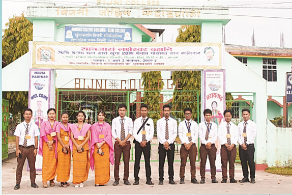
सानजारां लक्षेश्वर ब्रह्मनि थैनाय गोसोखां सान फालिनायाव बाहागो लाहैनाय।