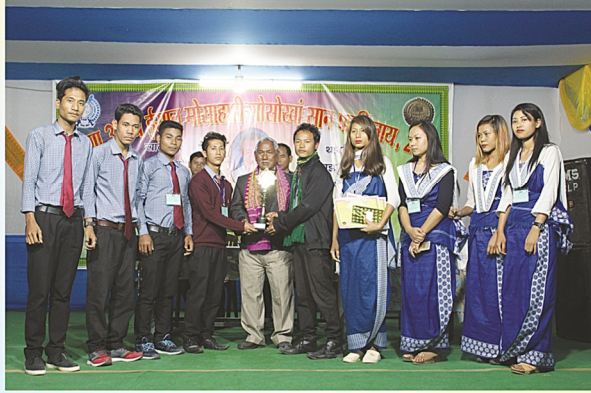
आर'नाय फरयसालिमा, (क'क्राझार)नि बादयारिनो बाछाय बान्था गथायनायनि नुथाय ।