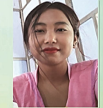
साहारा बरगयारी सोद्रोमा ।