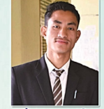
दैसा बरगयारी थुनलाइ बोसोनगिरि ।