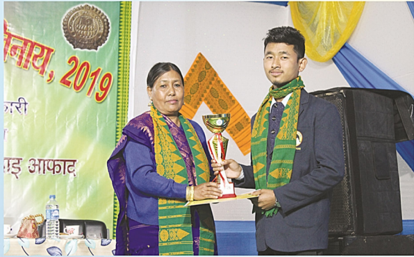
मुखी सिनायसाद बर'नो ईशान उनसंगिरि बान्था गथायनाय ।