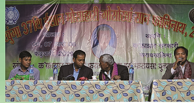
खुंगा 37थि ईशान मोसाहारी गोसोखां सान फालिनायाव सावराय मेलाव बाहागो लाफैनाय आलासि बिथांमोन।