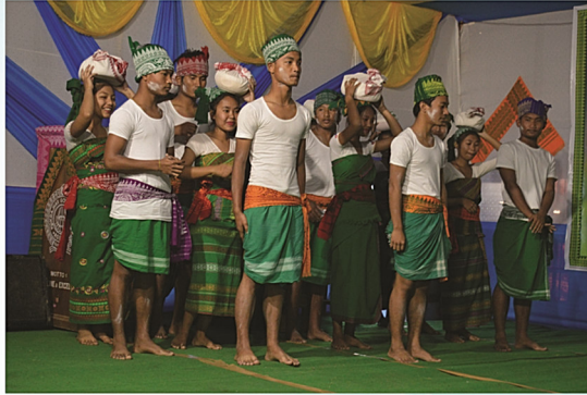
खुंगा 37थि ईशान मोसाहारी गोसोखां सान फालिनायाव बेखेवनाय मोसानायनि नुथाय।