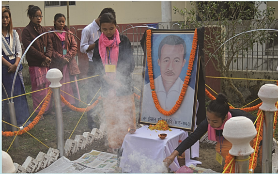
खुंगा 37थि ईशान मोसाहारी गोसोखां सान फालिनायाव बिबार बाउनयानि नुथाय।