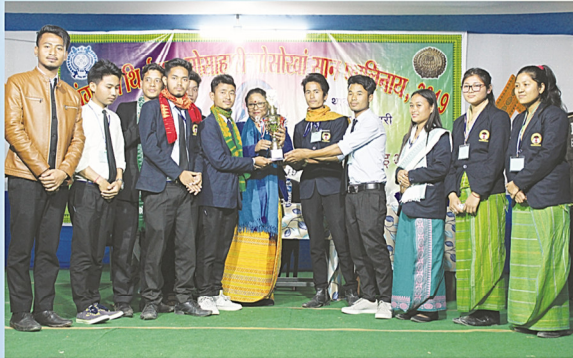
इउ.एन. एकाडेमी क'क्राझार फरयसालिमानि फरयसाफोरनो बासग'सार फरयसालिमा बान्था गथायनाय ।